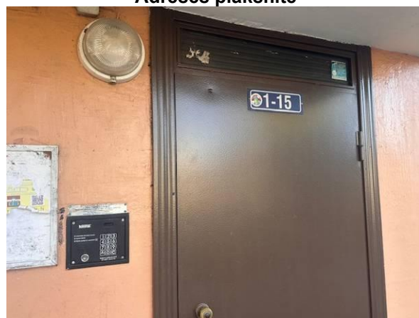
Kāpņu telpas ieejas durvis