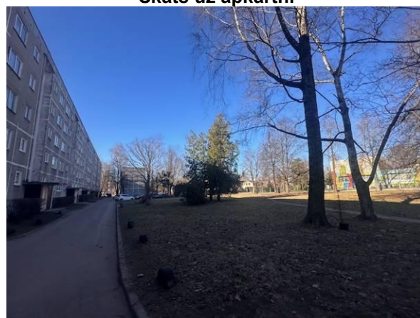
Skats uz apkārtni

Novērtējamais īpašums: Latgales iela 321 - 2, Rīga un 5441/511369 d.d. no zemes zem mājas