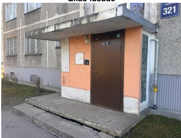
Ieeja mājas kāpņu telpā