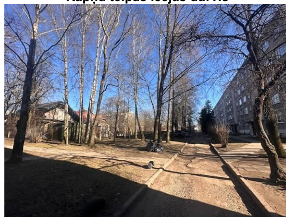
Skats uz apkārtni