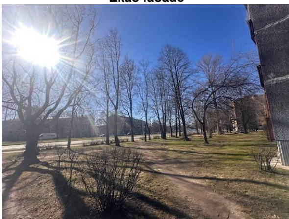
Skats uz apkārtni